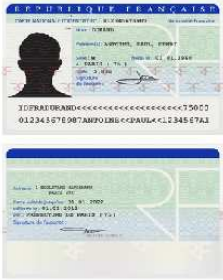
Modèle accepté - format A4